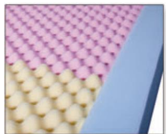
Struktura proti akumulaci tepla