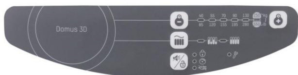
Ovládací panel Pacient 170 cm / 80 kg