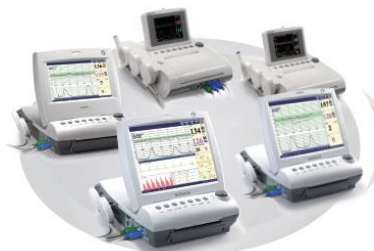
Fetální & Mateřské Monitory