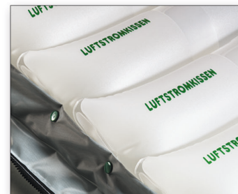
Vzduchové cely vyrobené z kvalitního polyuretanu