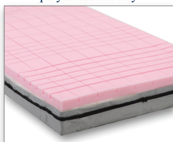
Kostková struktura zmírňující tlak