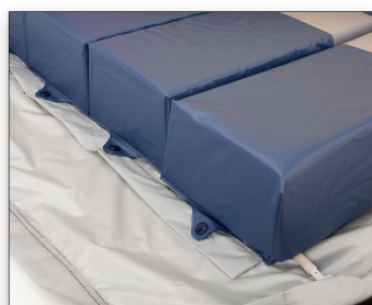
Jednotlivě odnímatelné polyuretanové cely